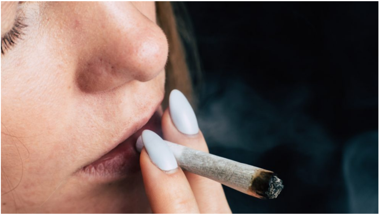
עישון קנאביס (אילוסטרציה)

מטרתו של מחקר זה הייתה לאפיין משתמשי קנאביס מסיבות רפואיות ומסיבות אחרות, מבחינת גורמים חברתיים-דמוגרפיים, המצבים הרפואיים שלהם והתחלואות הנפשיות הנלוות.