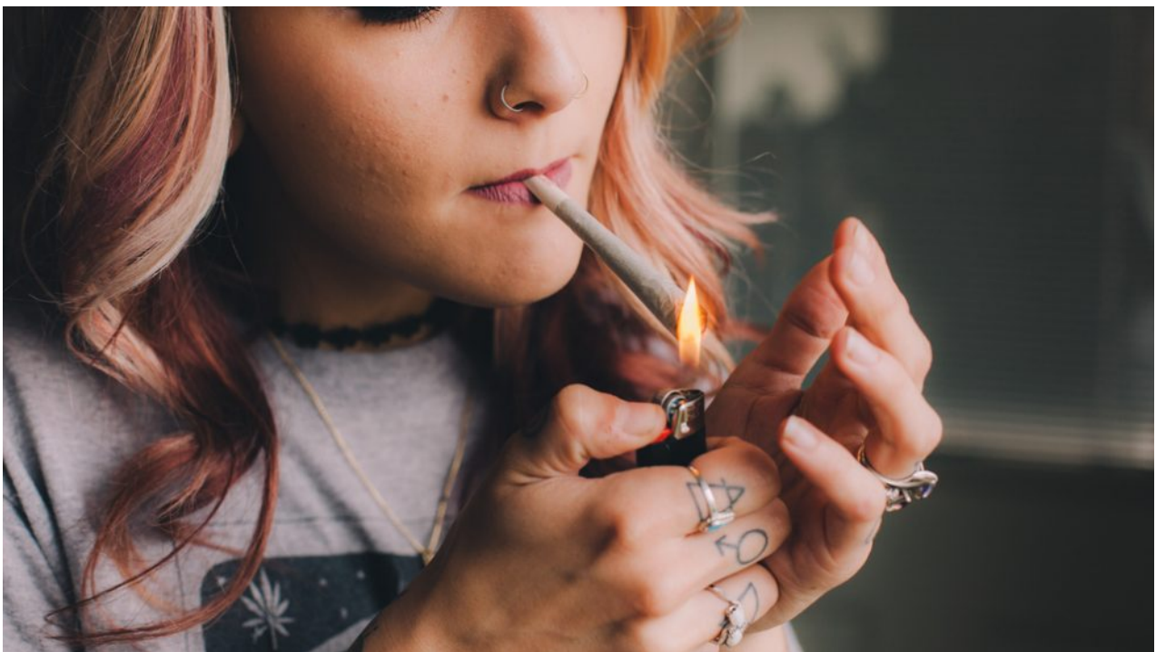
צעירה מעשנת קנאביס. אילוסטרציה

15,067 בני אדם – 11,850 גברים ו-3,217 נשים – טופלו בשנת 2018 בישראל בהתמכרויות לסמים ואלכוהול, זאת בהשוואה לשנת 2017 שבה טופלו 14,826. כך נמסר אתמול (ב') לרגל חודש המאבק בסמים ואלכוהול וערב השנה האזרחית החדשה.